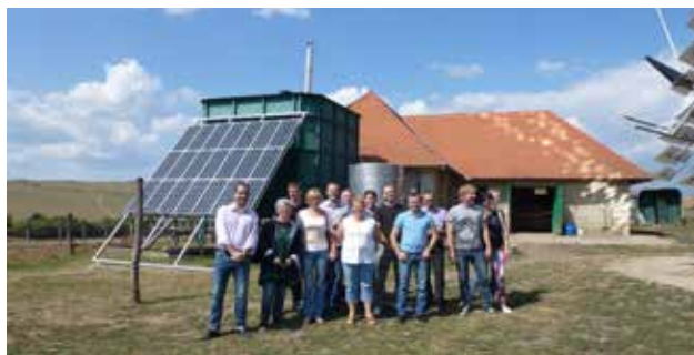
Los participantes del proyecto "Decarbonize our Future" en Bielorrusia, en 2015