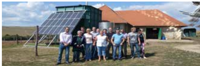
Les participants du projet organisé par INFORSE-Europe à la Biélorussie, 2015.